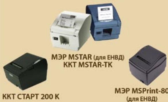
ККТ СТАРТ 200 К